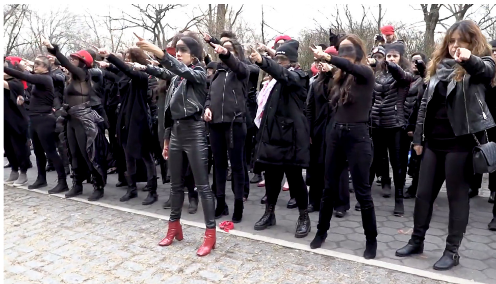
Un violador en tu camino , performance participativa LasTesis, activación en Nueva York, 2020

Chile, El Salvador, Estados Unidos, México, Nicaragua, Paraguay, Perú, República Dominicana, Uruguay y algunos episodios puntuales de otros contextos.