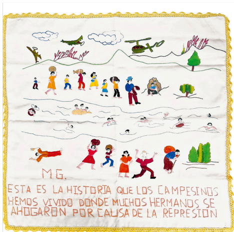
Colectivo de mujeres, Taller de bordados, Refugio de Mesa Grande (Honduras). M.G. Esta es la historia que los campesinos hemos vivido donde muchos hermanos se ahogaron por causa de la represión , 1981. Bordado sobre tela, 61,5 x 62 cm. Colección Museo de la Palabra y la Imagen, El Salvador

las protestas duramente reprimidas en los últimos tiempos.